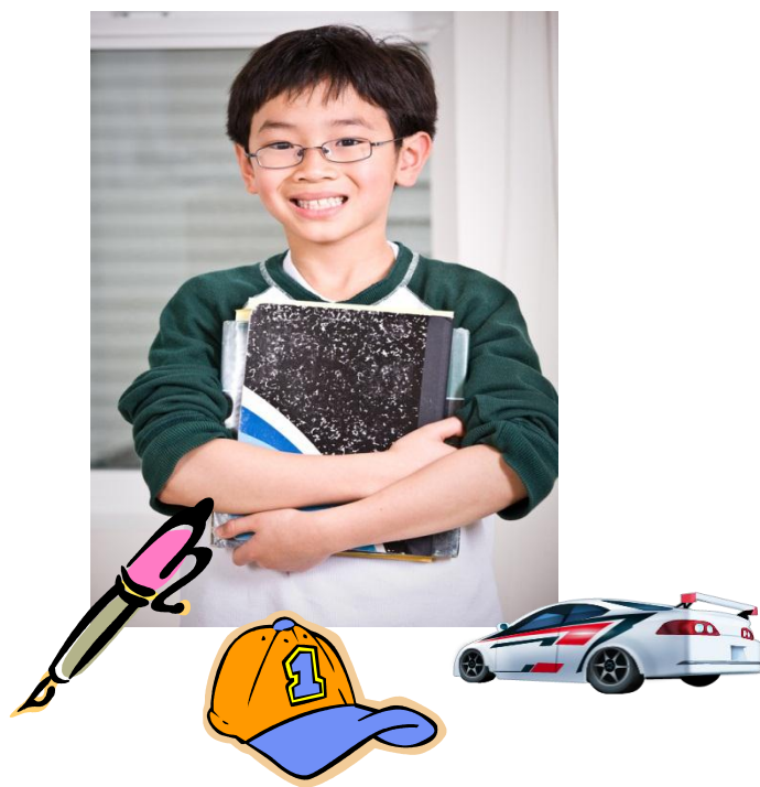
Das ist Daniel.

Laura hat einen Ball. Laura hat eine Lampe. Laura hat ein Buch.