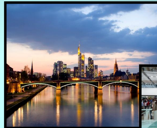
Frankfurt am Main