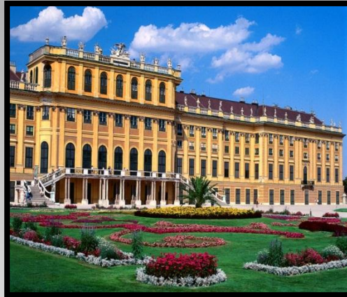
Schönbrunn in Wien